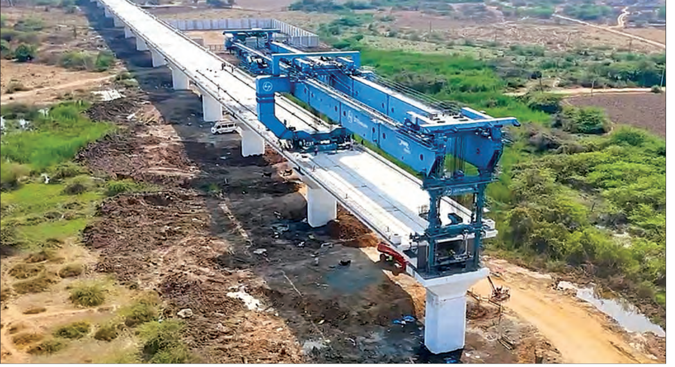
पूर्ण स्पॅन लॉन्चिंग गॅंटी वापरून गर्डर लॉन्चिंग प्रगतीपथावर, सुरत जिल्हा, गुजरात