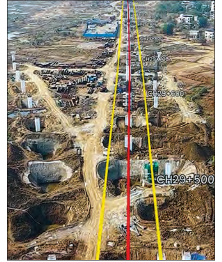
वायडवट का निर्माण प्रगती पर, ठाणे जिला, महाराष्ट्र

तीन शाफ्ट, बीकेसी (सी1 पॅकेज अंतर्गत), विक्रोळी आणि सावली येथे प्रत्येकी एक, टनेल बोरिंग मशीन (टीबीएम) बोगद्याच्या बांधकामाला टप्पाटप्प्याने मदत करतील, आणि घणसोली येथील एडीआयटी बोगदा आणि शिल्पफाटा येथील बोगद्याचे प्रवेशद्वार एनएटीएम (एनएटीएम) द्वारे बोगद्याच्या बांधकामाला मदत करतील.