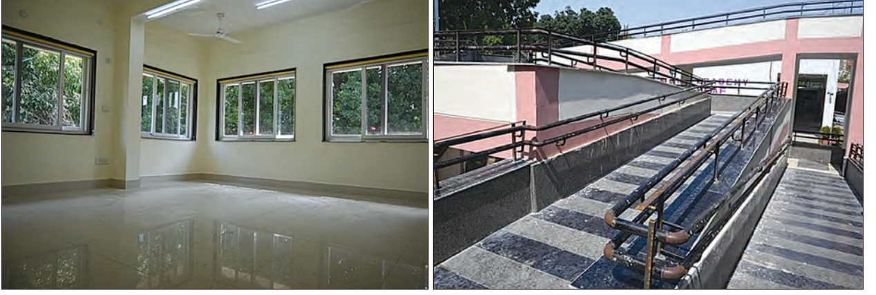
सीएसआर प्रकल्प – वर्गखोली आणि रॅम्पचे बांधकाम, एएडी, आयआयटी रुरकी, उत्तराखंड