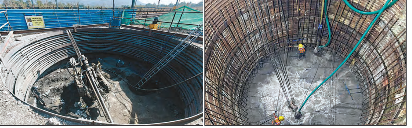
पालघर, महाराष्ट्र येथे शिन्शो पाइलचे काम प्रगतीपथावर