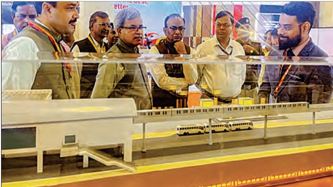
आयआयटीएफ 2024 – प्रस्तावित मुंबई एचएसआर स्टेशन मॉडेल

आपली कंपनी विविध राष्ट्रीय आणि आंतरराष्ट्रीय प्रदर्शने/मेळे इत्यादींमध्ये भाग घेते. 2024–25 दरम्यान, कंपनीने नोव्हेंबर 2024 मध्ये नवी दिल्ली येथील प्रगती मैदान येथे आयोजित इंडिया इंटरनॅशनल ट्रेड फेअर 2024 मध्ये रेल्वे पॅव्हेलियनचा भाग म्हणून प्रस्तावित मुंबई एचएसआर स्टेशनचे बांधकाम अंतर्गत मॉडेल प्रदर्शित केले. याव्यतिरिक्त, आपल्या कंपनीने ऑक्टोबर 2024 मध्ये गुजरात येथे अर्बन मोबिलिटी इंडिया परिषद आणि प्रदर्शन 2024 मध्ये आणि नोव्हेंबर 2024 मध्ये लखनऊ येथे इनोरेल 2024 मध्ये देखील भाग घेतला.