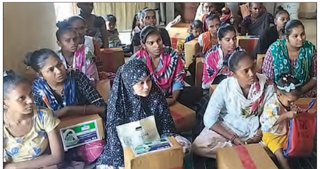
सीएसआर प्रकल्प – शक्ती किटचे वितरण, गुजरात