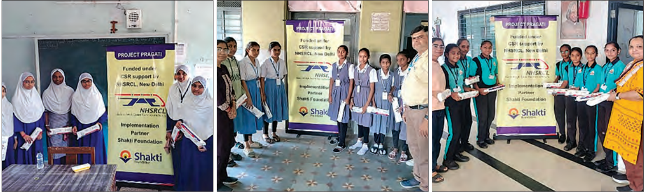
सीएसआर प्रकल्प - स्वयं सहायता गट, गुजरातची स्थापना

कंपनीने सीएसआर क्रियाकलापांच्या निवडीसाठी एक प्रणाली तयार केली आहे, ज्याद्वारे क्षेत्रीय स्तरावरील कार्यालये भागधारकांशी संवाद साधल्यानंतर स्थानिक गरजांवर आधारित सीएसआर प्रस्ताव शिफारस करू शकतात.