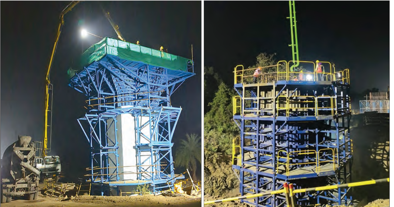
पियर कॅप आणि पियर कास्टिंगचे काम प्रगतीपथावर, पालघर जिल्हा, महाराष्ट्र

जपानने त्यांच्या पूर्वीच्या ई5 शिकानसेन ट्रेनच्या प्रस्तावाऐवजी अधिक प्रगत ई10 शिकानसेन ट्रेनची ऑफर दिली आहे, ज्या सध्या जपानमध्ये उत्पादनात नाहीत. जपानी प्रस्तावानुसार, ई10 शिकानसेन 2030 च्या सुरुवातीस जपानमध्ये सादर होण्याची अपेक्षा आहे आणि त्यानंतर भारतीय हवामान परिस्थितीनुसार आवश्यक डिझाइन बदल करून 2032 पर्यंत एमएचएसआर कॉरिडॉरवर चाचणीसाठी ऑफर केली जाईल अशी अपेक्षा आहे.