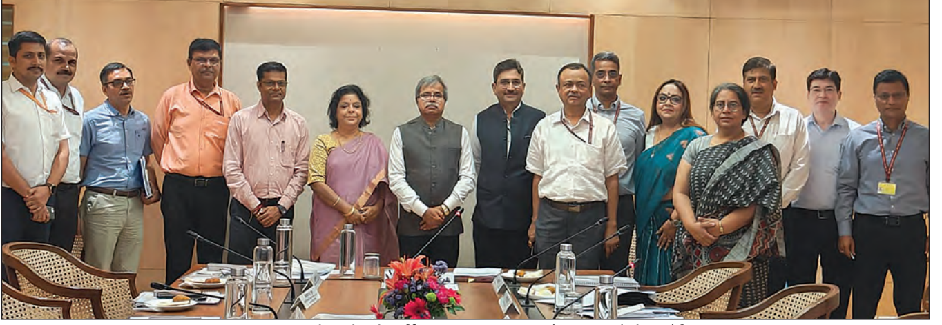
एनएचएसआरसीएलची 9वीं वार्षिक सामान्य सभा 16 सप्टेंबर 2025 रोजी आयोजित

आपली कंपनी अजूनही बांधकाम टप्प्यात असल्याने, तिने अद्याप वाणिज्यिक परिचालन सुरु केलेले नाही. 31 मार्च 2025 पर्यंत एकूण भांडवली काम प्रगतीपथावर रु. 55,544.23 कोटी (अंदाजे) आहे.