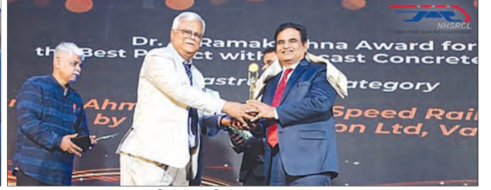
इंडियन कॉंक्रीट पुरस्कार 2024