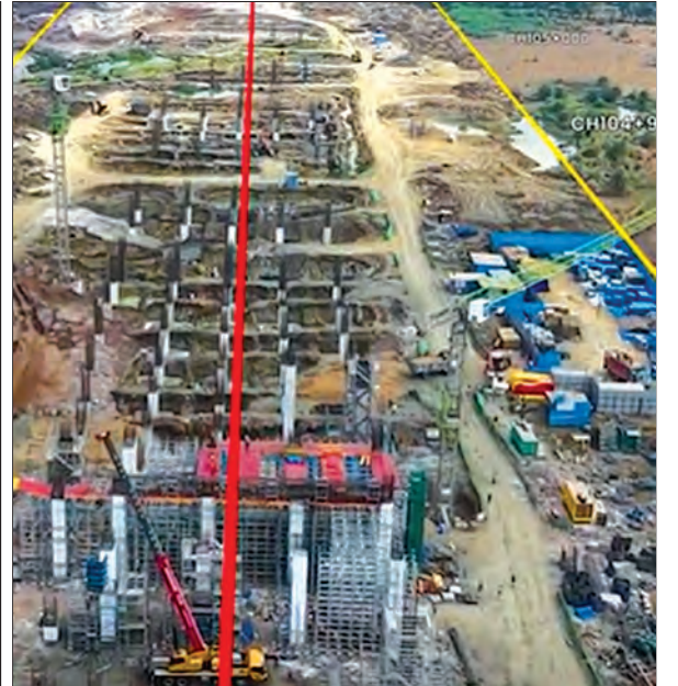
एचएसआर स्टेशनावर काम प्रगतीपथावर, महाराष्ट्र