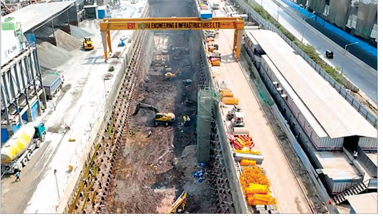
शाफ्ट उत्खनन पूर्ण झाले आणि आरसीसीचे काम प्रगतीपथावर, मुंबई, महाराष्ट्र

2024-25 दरम्यान, दोन्ही शाफ्ट (2 आणि 3) आणि एडीआयटी बोगद्यासाठी उत्खनन; स्लॅबची कामे; शाफ्ट (2 आणि 3) येथील सांडपाणी प्रक्रिया प्रकल्प (एसटीपी), टीएसएस, आणि डीएसएस क्षेत्र; कार्स्टिंग यार्डची स्थापना; आणि 1011 टीबीएम रिंग्जचे (म्हणजे 2 किमी) कार्स्टिंग पूर्ण झाले आहे. दोन्ही शाफ्टवर टीबीएम खाली उतरवण्यासाठी आणि सुरु करण्यासाठी तयारीचे काम, तसेच टीबीएम रिंग कार्स्टिंगची कामे आणि मुख्य एनएटीएम बोगद्याचे (3 बाजू) उत्खनन काम प्रगतीपथावर आहे. टीबीएम वापरून प्रत्यक्ष बोगदा खोदण्याचे काम अद्याप हाती घेण्यात आलेले नाही.