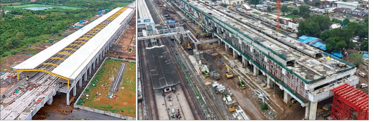
एचएसआर स्टेशनांवर काम प्रगतीपथावर, गुजरात