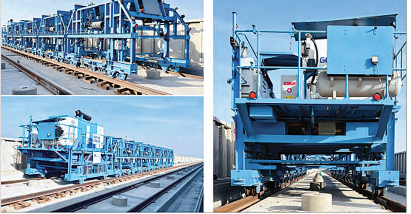
ट्रॅक स्लॅब लेइंग कार