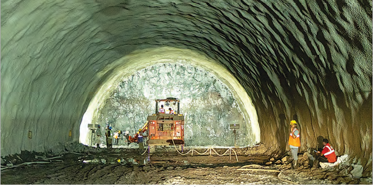
मुख्य बोगद्याचे उत्खनन (एनएटीएम) पूर्ण, ठाणे जिल्हा, महाराष्ट्र