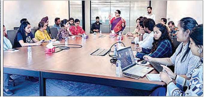
POSH आणि सामायिक पालकत्व या विषयावरील सत्र