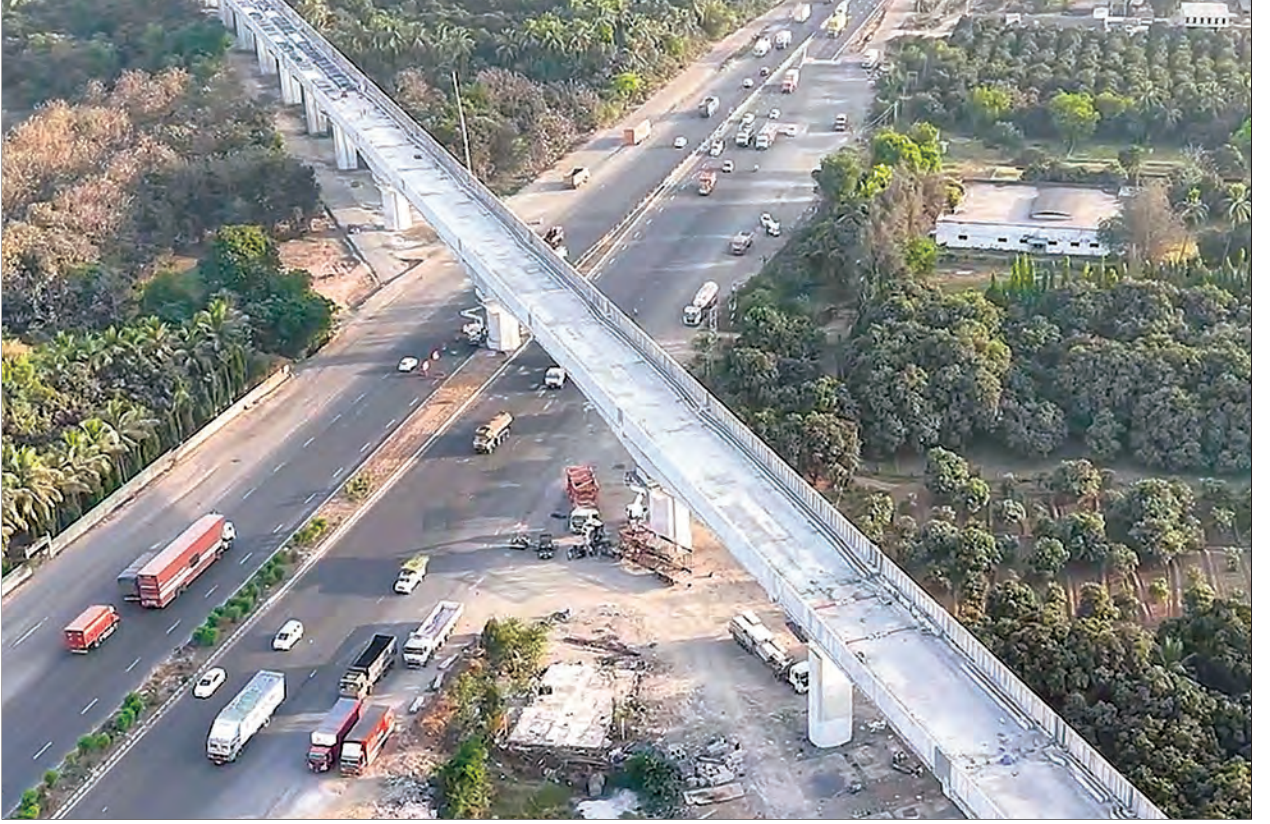
नवसारी जिल्हा, गुजरात येथील पीएससी पुलाचे (जीएडी - 11) बांधकाम पूर्ण.