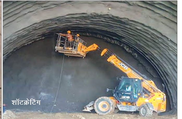
बोगद्याचे काम प्रगतीपथावर, पालघर जिल्हा, महाराष्ट्र