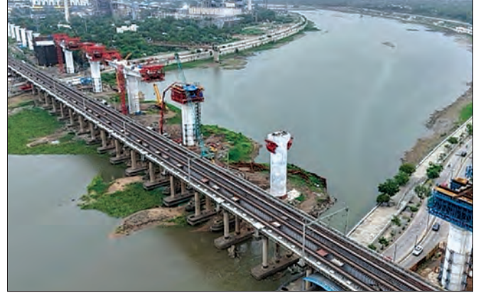
साबरमती नदी पूल, अहमदाबाद, गुजरात येथे काम प्रगतीपथावर