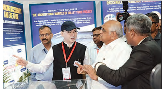
अर्बन मोबिलिटी इंडिया प्रदर्शन 2024, गांधीनगर, गुजरात