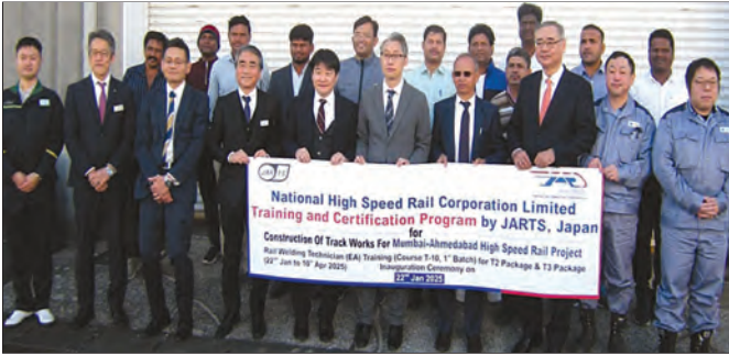
वेल्डिंग ऑफ रेलस (EA), टी आणि सी कोर्स, जपान