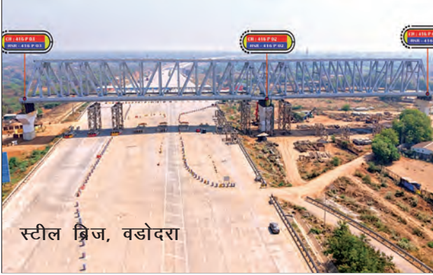
स्टील ब्रिज, वडोदरा

गुजरातमधील वलसाड जिल्ह्यात (सी4 पॅकेजचा भाग) असलेल्या एकमेव बोगद्याचे (सुमारे 320 मीटर) काम 2023-24 दरम्यान आधीच पूर्ण झाले होते.