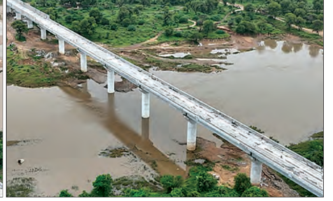
अहमदाबाद जिल्ह्यात पूर्ण झालेले नदी पूल, गुजरात