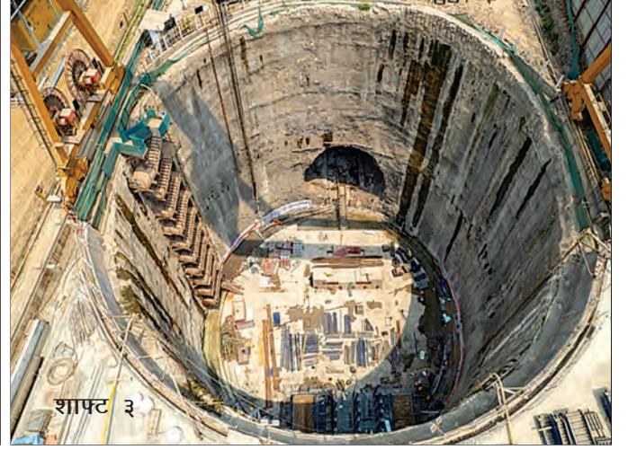
टीबीएम सुरु करण्यासाठी कॉंक्रीटचे काम प्रगतीपथावर, मुंबई, महाराष्ट्र