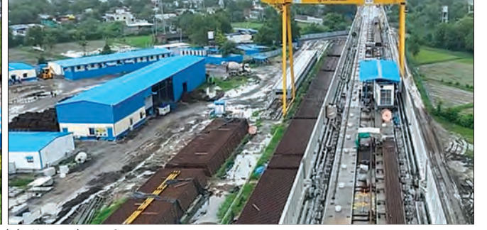
ट्रॅक बांधकाम बेस, गुजरात येथे ट्रॅक कामे प्रगतीपथावर

अशा प्रकारे, 31 मार्च 2025 पर्यंत, एकूण सात (7) टीसीबी स्थापित करण्यात आले आहेत म्हणजे टी2 पॅकेजमध्ये 3 आणि टी3 पॅकेजमध्ये 4.