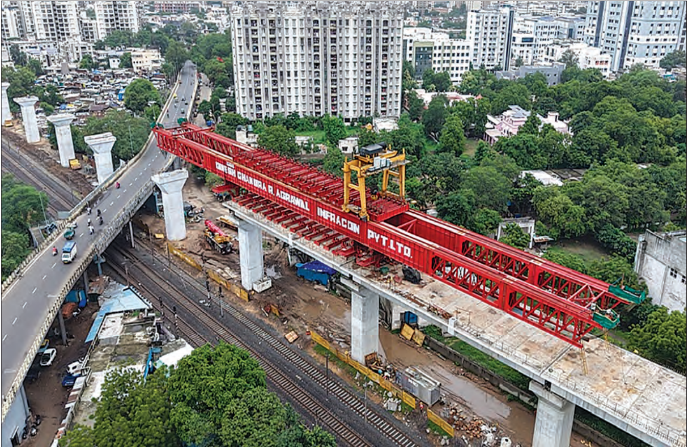
सेगमेंटल लॉन्चिंग गॅट्टी वापरून गर्डर लॉन्चिंग प्रगतीपथावर, अहमदाबाद जिल्हा, गुजरात

एमएचएसआर संरेखनाशी संघर्ष करणाऱ्या विद्यमान भारतीय रेल्वे सुविधा आणि पायाभूत सुविधा, म्हणजे धावपट्ट्या, रेल्वे प्लॅटफॉर्मसह इतर महत्त्वाच्या उत्पादन आणि देखभाल सुविधा आणि कार्यालये / कर्मचारी निवासस्थाने इत्यादी गुजरात आणि महाराष्ट्रात पश्चिम रेल्वेच्या समन्वयाने स्थलांतरित / पुनर्स्थापित करण्यात आल्या आहेत.