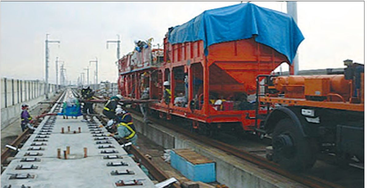
कॉम इन्जेक्शन कार