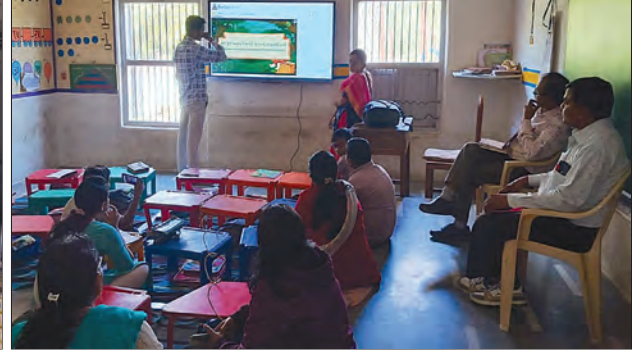
सीएसआर प्रकल्प – स्मार्ट वर्ग स्थापन करणे, नवसारी जिल्हा, गुजरात