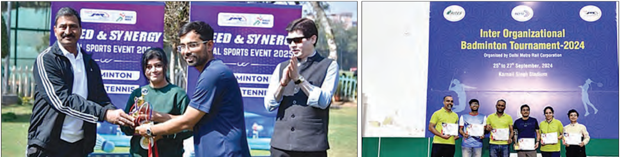
क्रीडा स्पर्धा आणि आंतर-संस्था बॅडमिंटन चॅम्पियनशिप (डीएमआरसी, एनसीआरटीसी आणि राईट्स यांच्यात)

स्थापना दिनानिमित्त, कर्मचार्यांनी केलेल्या उत्कृष्ट कामाचे कौतुक आणि बक्षीस देण्यात आले. कंपनीची सर्व प्रकल्प कार्यालये व्हिडिओ कॉन्फरन्सद्वारे या उत्सवाशी जोडली गेली होती. जिका आणि जपान दूतावासातील वरिष्ठ अधिकार्यांनी या प्रसंगाची शोभा वाढवली.