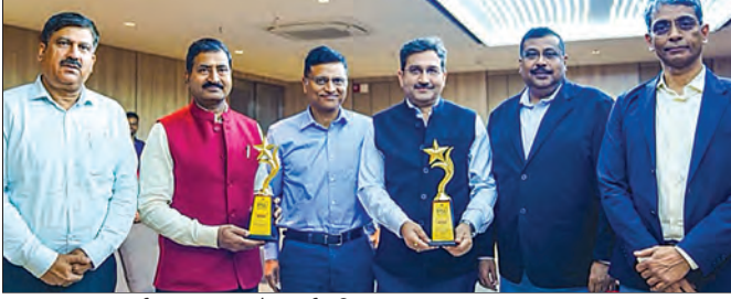
गव्हर्नन्स नाऊ 11वे सार्वजनिक उपक्रम पुरस्कार 2024