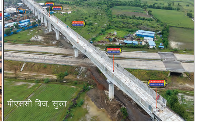
पीएससी ब्रिज, सुरत